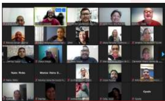
Preparação do Ramo para as Brigadas Digitais - 2022