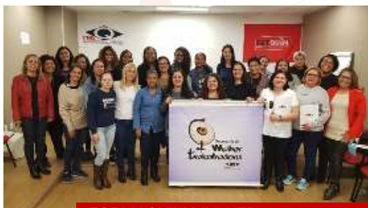
FORMAQUIM MULHER São Paulo, 2019

De forma inédita, o Ramo Químico da CUT, em parceria com a FETQUIM, organizou o curso Ativismo Digital, ministrado 100% para dezenas de dirigentes de vários estados. Inspirada no projeto Brigadas Digitais da CUT, a iniciativa capacitou companheiras e companheiros para a disputa política na web e para o enfrentamento às fake news disseminadas pela extrema direita.