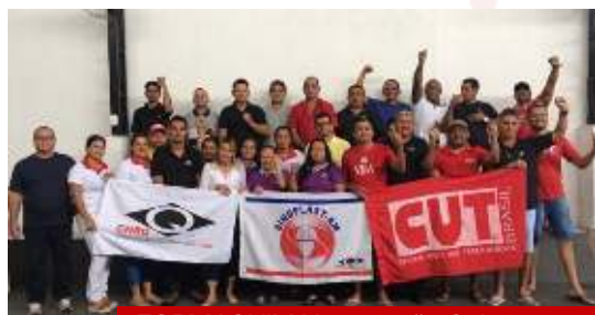
FORMAQUIM Negociação Coletiva Manaus, 2018