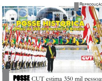
REPRODUÇÃO POSSE CUT estima 350 mil pessoas

O golpe contra a presidenta Dilma Rousseff (PT), em 2016, deu início a um período de trevas que se