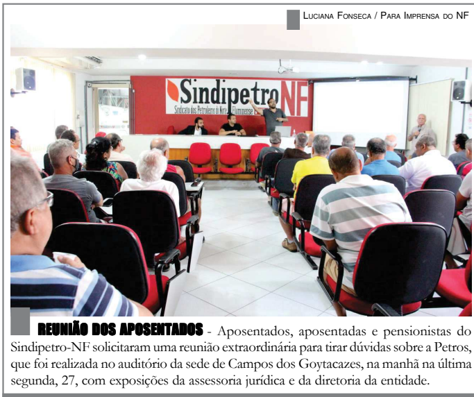
REUNIÃO DOS APOSENTADOS - Aposentados, aposentadas e pensionistas do Sindipetro-NF solicitaram uma reunião extraordinária para tirar dúvidas sobre a Petros, que foi realizada no auditório da sede de Campos dos Goytacazes, na manhã na última segunda, 27, com exposições da assessoria jurídica e da diretoria da entidade.

aconchegante e descontraído. A organização orienta às pessoas que pretendem chegar tarde a levar sua canga, porque as esteiras são limitadas.