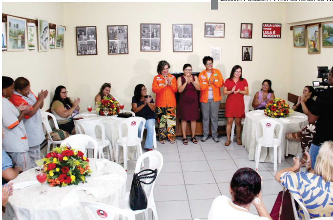
LUCIANA FONSECA / PARA IMPRENSA DO NF

CULTURA - FORMAÇÃO - EVENTOS - JURÍDICO - ÚLTIMAS