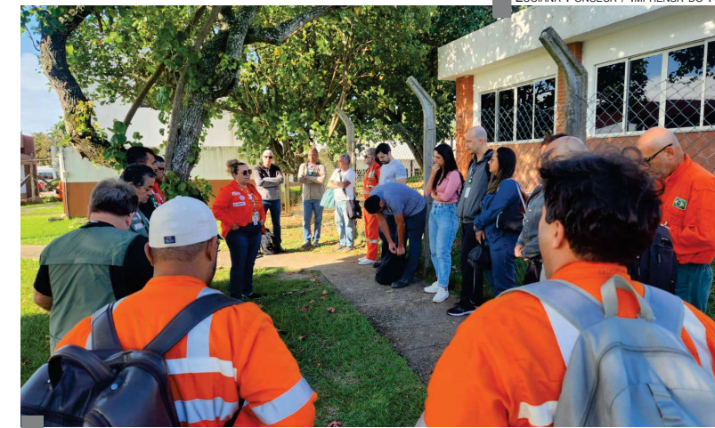
ASSEMBLEIAS NO NF Categoria reunida em um dos grupos da base de Cabiúnas

As assembleias prosseguem ao longo desta semana, com o mesmo quadro de indignação que está levando a categoria a rejeitar por unanimidade o que foi proposto pela empresa. No Rio Grande do Sul, os petroleiros finalizam nesta terça, 24, as assembleias; no Ceará e em Duque de Caxias, a consulta à categoria termina na quarta, 25, e