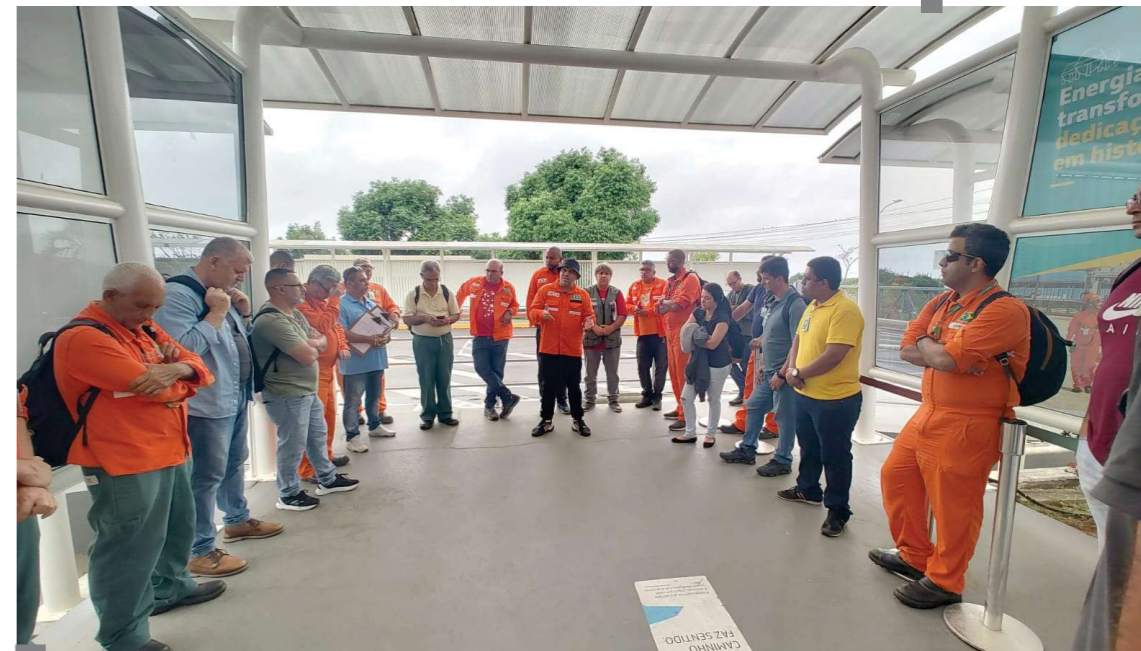
CABIÚNAS - As assembleias nas bases de terra no NF tiveram início pelos turnos. Imagem da Assembleia realizada no dia 3.

Categoria segue os indicativos da FUP e do Sindipetro-NF e com 98% dos votos mostram sua rejeição à primeira proposta de PLR apresentada pela Petrobrás. Assembleias vão até o dia 7 de janeiro no Norte Fluminense