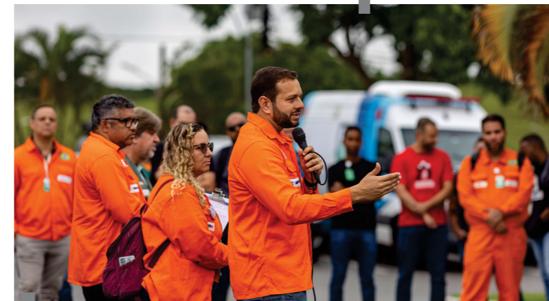
CABIÚNAS - Base teve assembleia em todos os turnos

Realizaram assembleias no Norte Fluminense as bases de Cabiúnas, Barra do Furado, Parque de Tubos, Praia Campista e as plataformas PCH-1, P-09, P-19, P-25, P-26, P-31, P-35, P-37, P-38, P-40, P-43, P-47, P-48, P-51, P-52, P-53, P-54, P-55 e P-62.