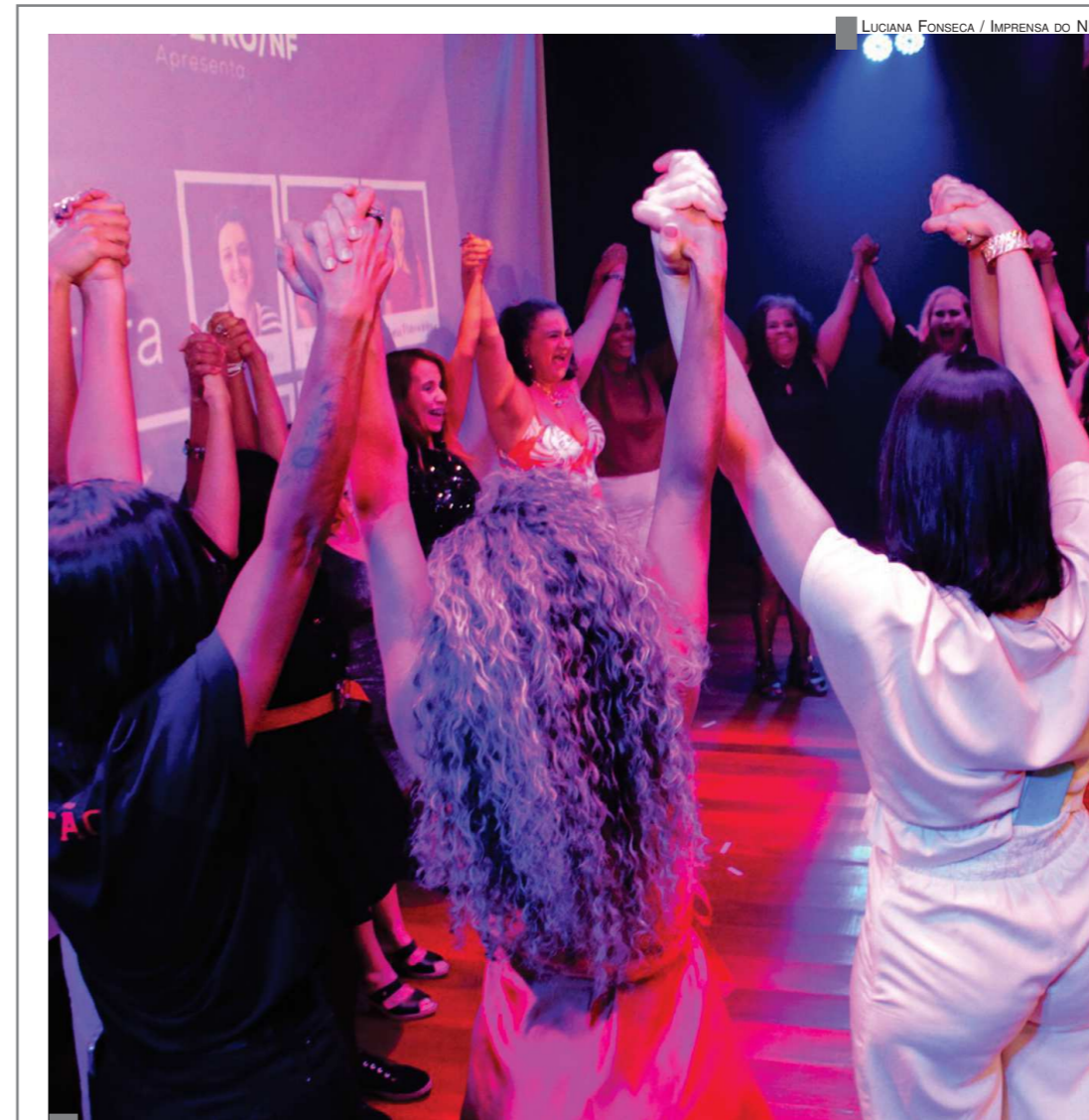
MULHERES NA LUTA - Encerramento das atividades do Mês da Mulher teve mostra cultural - pág. 4

Presidente participa, em Niterói, de nova atividade que impulsiona o setor naval no Rio de Janeiro. Categoria petroleira foi representada por dirigentes sindicais