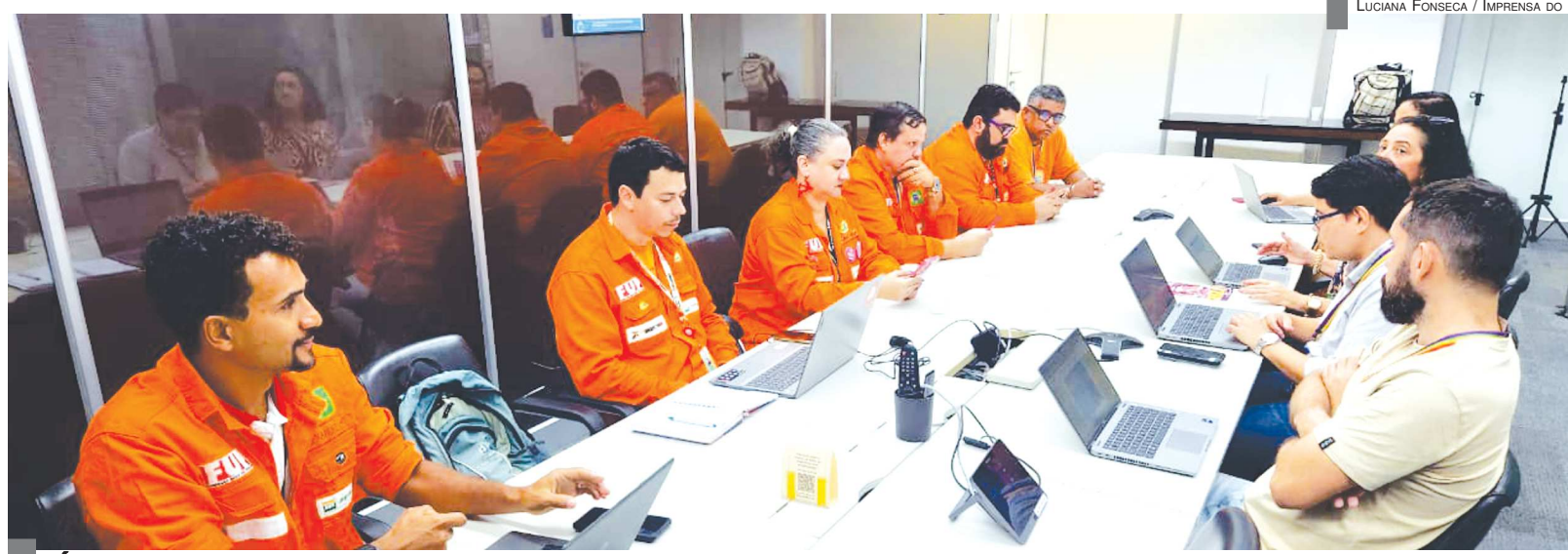
DIALOGO - Diretoria do NF durante reunião com representantes das áreas de RH e SMS locais da Petrobrás. Encontro discutiu mais de 20 demandas regionais