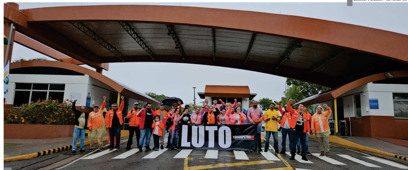
ATO EM CABIÚNAS - Petroleiros e petroleiras realizaram ato na entrada principal da base de Cabiúnas, em Macaé, onde acidente matou uma engenheira