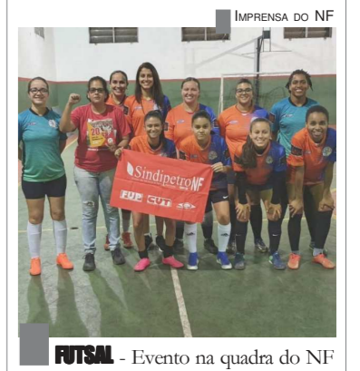
FUTSAL - Evento na quadra do NF

Essa é uma oportunidade para os petroleiros e petroleiras reunirem suas equipes e praticarem esporte em um ambiente preparado para receber a categoria, além de ser uma forma de promover a integração entre os diferentes segmentos da categoria petroleira.