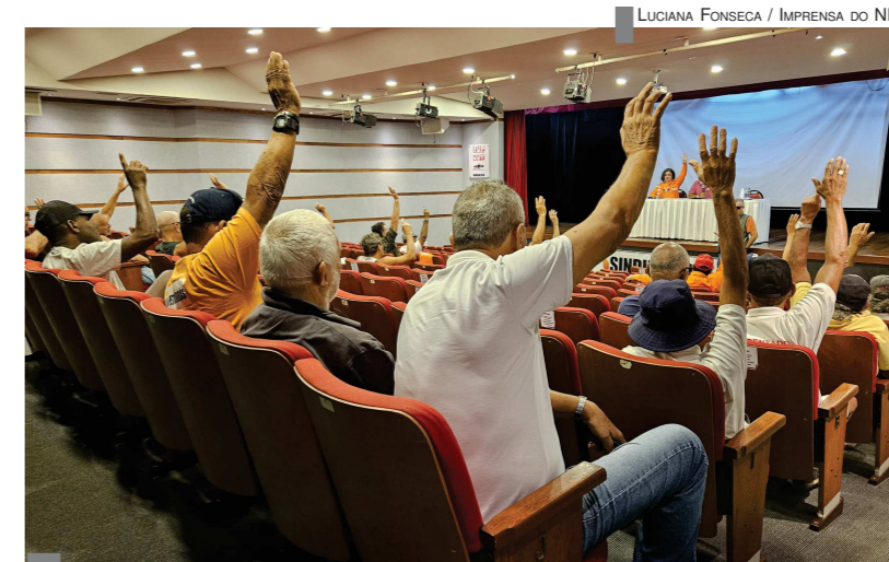
CATEGORIA NA LUTA Assembleia de aposentados e pessoal em folga no NF

Na segunda, 11, a FUP e seus sindicatos realizam Conselho Deliberativo para discutir e apontar os próximos passos da campanha de PLR e das negociações com a Petrobrás sobre a pauta de SMS que foi aprovada nas assembleias. Após a reunião do