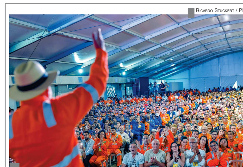
RETOMADA - Presidente Lula discursa para trabalhadores no evento de Angra

Em janeiro, a Petrobrás altera unilateralmente o sistema de teletrabalho.