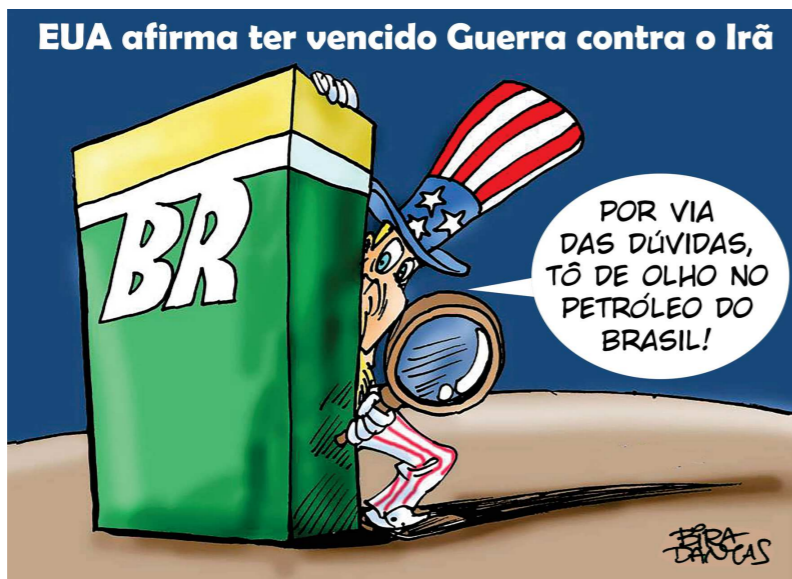
EUA afirma ter vencido Guerra contra o Irã

Para os petroleiros e petroleiras, essa mobilização tem significado especial. Como categoria estratégica, com histórico de organização e lutas decisivas para o país, sua participação fortalece o conjunto do movimento sindical, com a defesa de direitos, da soberania e da Petrobrás e pela reestatização da BR Distribuidora. Nossos jalecos laranja também tomarão Brasília.