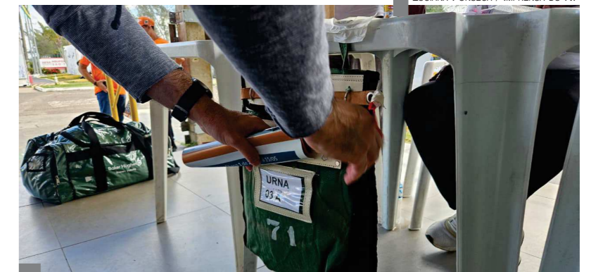
PARTICIPAÇÃO Urnas físicas e votação online estão disponíveis para categoria