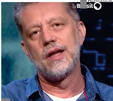
CARARINE Trabalhador fica com 6%

Mesmo com os excelentes resultados do primeiro trimestre, a gestão da Petrobrás segue defendendo uma política de austeridade para os tra-